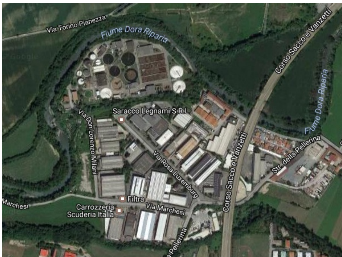
Area Rosa Luxemburg